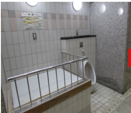
③(既設)ベビーベッド