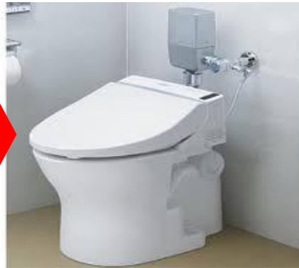
①洋式便器の設置(イメージ)