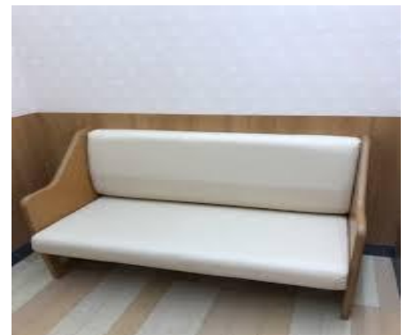
③授乳スペースの設置 (イメージ)