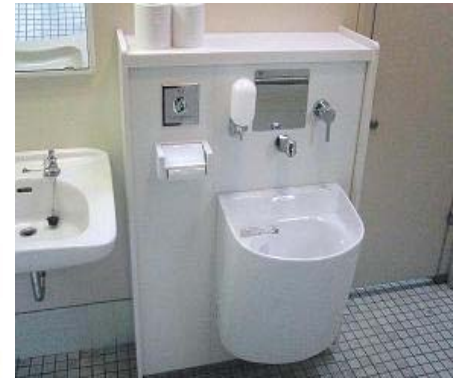
②オストメイトの設置(イメージ)