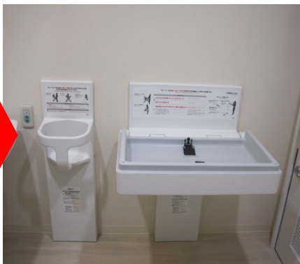
③ベビーベッド、 ベビーチェアの設置(イメージ)