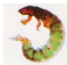
コガタシマトビケラ