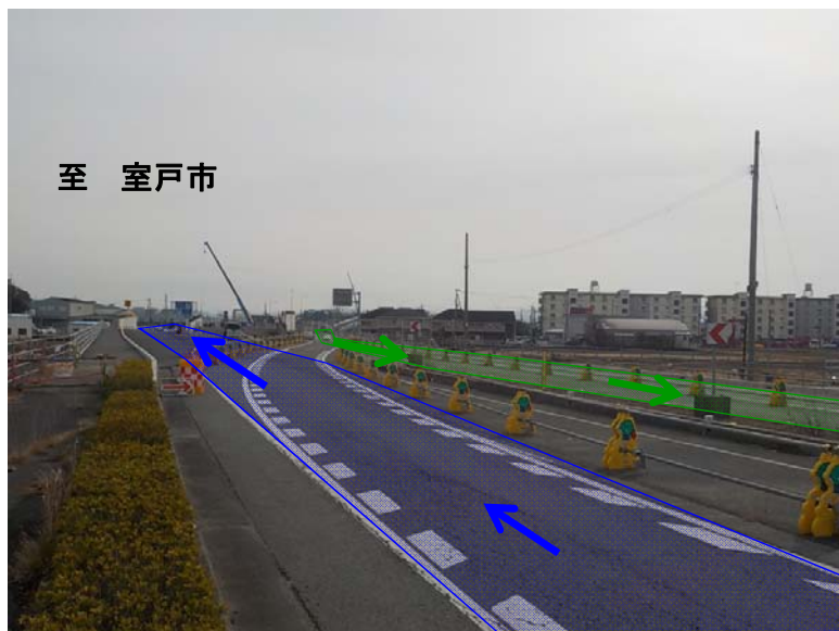
徳島市方面より室戸市方面を望む