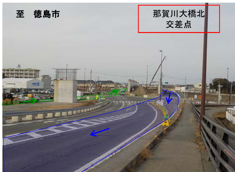
室戸市方面より徳島市方面を望む