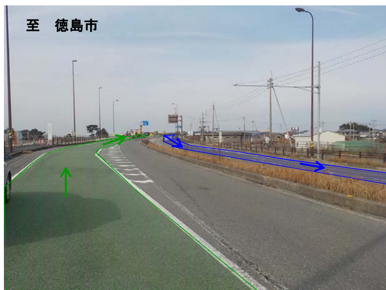
室戸市方面より徳島市方面を望む