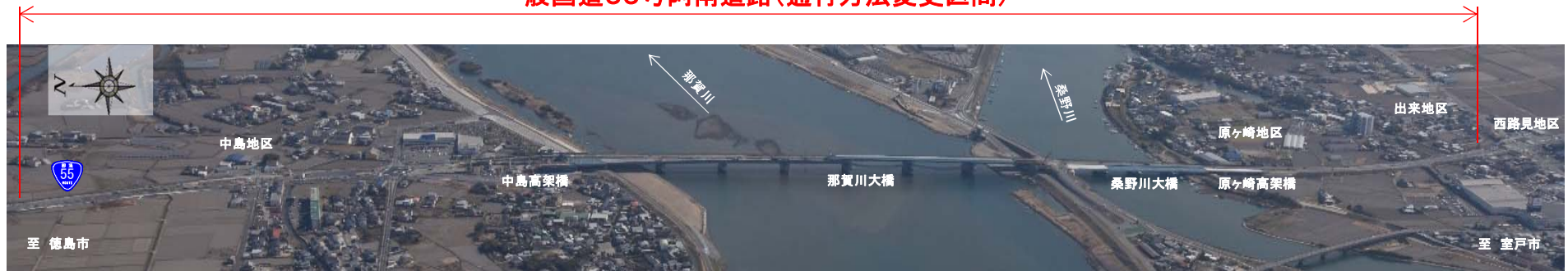
一般国道55号阿南道路(通行方法変更区間)