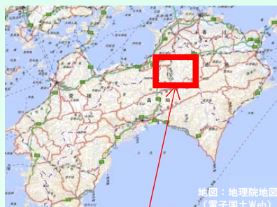
地図：地理院地図（電子国土Web）