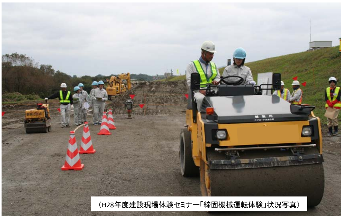
(H28年度建設現場体験セミナー「締固め機械運転体験」状況写真)

※着色部が、国土交通省徳島河川国道事務所発注工事。 取材希望の方は現場までお越し下さい。(地図は、別紙1-3)