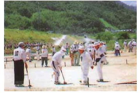
地域交流（グラウンドゴルフなど）