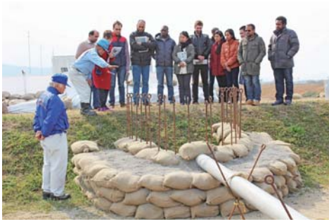
水防工法技術講習会

「石井地区河川防災ステーション」は、洪水時等に実施する水防活動に必要な資材の備蓄や水防活動の現地対策本部などの役割を果たす「水防拠点」、吉野川の歴史や自然環境など様々な情報を提供する「川の情報発信拠点」、地域の憩いの場であり人や地域の交流の場を提供する「交流拠点」の3つの機能を柱としています。