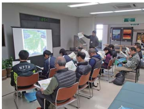
吉野川歴史講習会