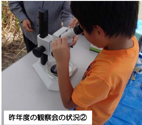
昨年度の観察会の状況②