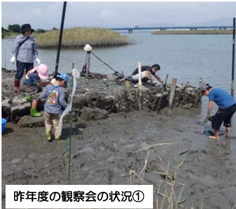
昨年度の観察会の状況①

このような貴重なカニたちを観察し、吉野川環境についての現状を知ってもらいながら、豊かな自然にも親しんでいただく「干潟観察会」を開催します。