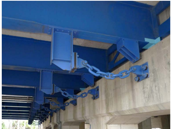
現在の耐震補強状況