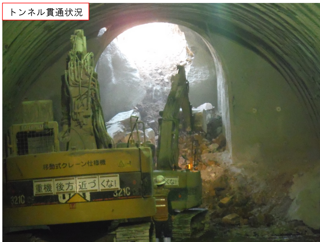
トンネル貫通状況