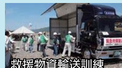
救援物資輸送訓練