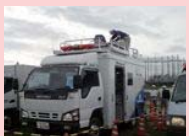
携帯電話回線復旧訓練