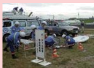
特設公衆電話設営訓練