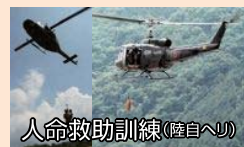
人命救助訓練(陸自へリ)