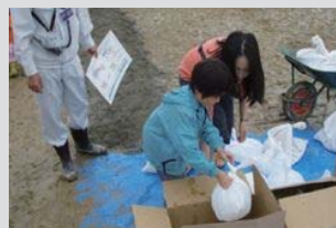
家庭でできる水防工法体験