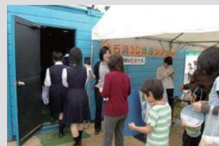
土石流3Dシアター体験