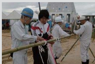
ロープワーク体験