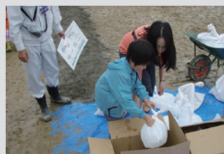
家庭でできる水防工法体験