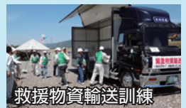
救援物資輸送訓練