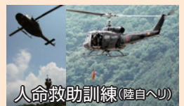
人命救助訓練(陸自ヘリ)