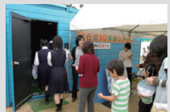
土石流3Dシアター体験