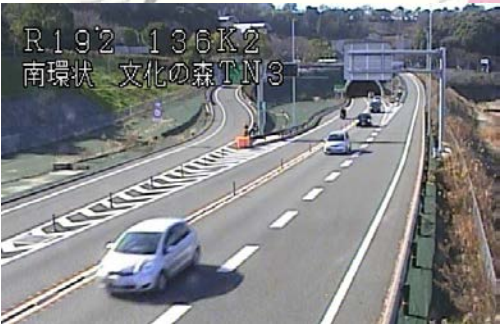
文化の森IC付近より西側方向望む (H29.1.1 13時03分頃)