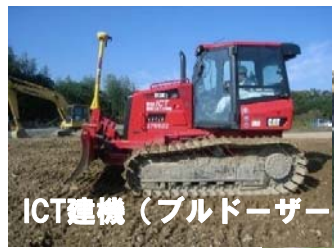
ICT建機（ブルドーザー）