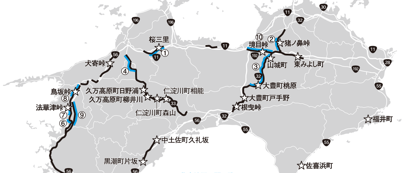
集中除雪区間一覧