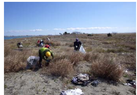
平成27年度の講座の状況②