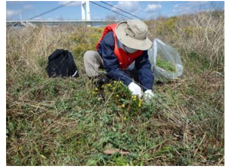
平成27年度の講座の状況①