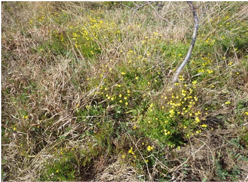
吉野川河口干潟(ナルトサワギク繁殖状況)

徳島河川国道事務所では、吉野川の抱える環境の問題点を知っていただくとともに、地域の皆さんの力を借りてナルトサワギクの抜き取りによる駆除作業を行い、吉野川河口干潟の海浜植物などを守るため、吉野川現地(フィールド)講座を開催します。