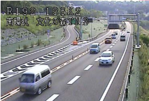
文化の森IC付近より西側方向望む (H28.8.14 16時00分頃)