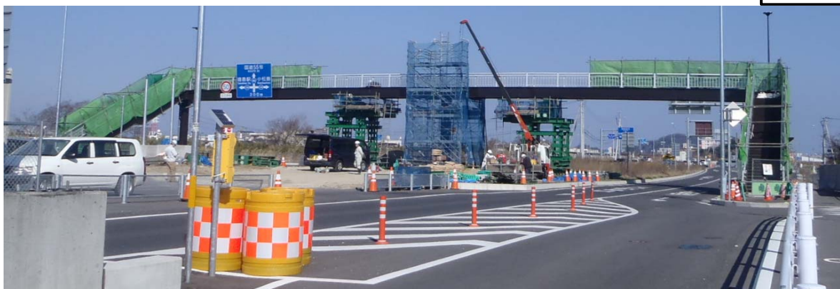
工事中の八南スマイル歩道橋

※上記地図は、国土地理院ホームページ( http://maps.gsi.go.jp/#18/34.041521/134.536003 )をもとに作成。