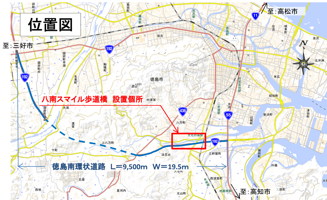
※上記地図は、国土地理院ホームページ ( http://maps.gsi.go.jp/#16/34.054153/134.5537716 ) をもとに作成。