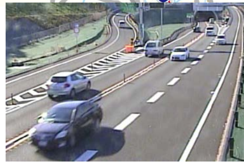
文化の森IC付近より西側方向望む (H28.1.1 14時10分頃)