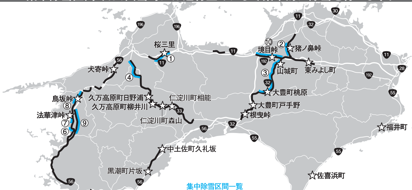
集中除雪区間一覧