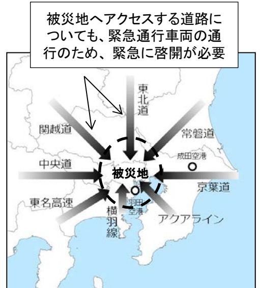
(首都直下地震における八方向作戦の例)