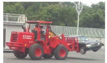
車両移動のための具体的方策 （例：ホイールローダーによる移動）