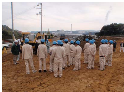
工事機材の説明中