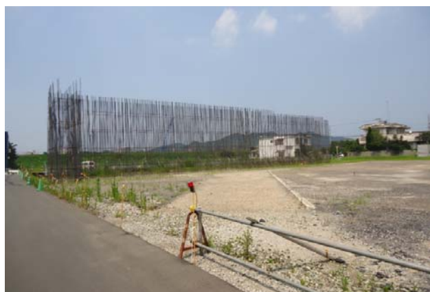
平成27年度 小松島地区C1ランプ橋下部工事(平成27年10月現在)