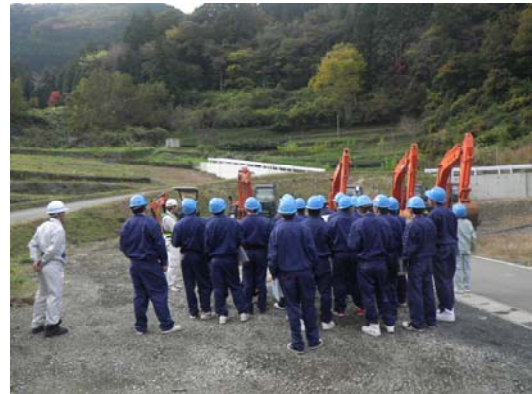
工事機材の説明中