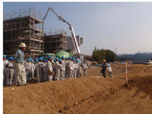
現場状況の説明中