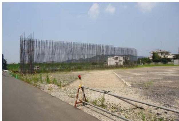
平成27年度 小松島地区C1ランプ橋下部工事(平成27年10月現在)