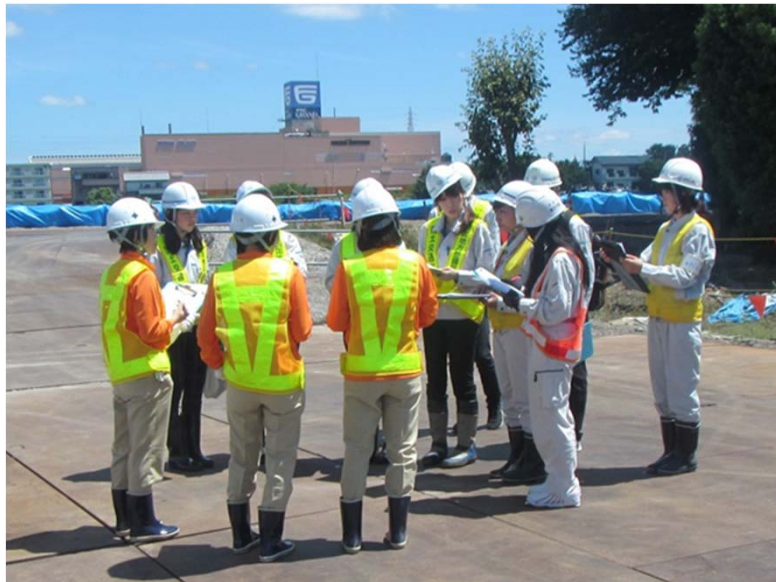
安全パトロールの実施イメージ