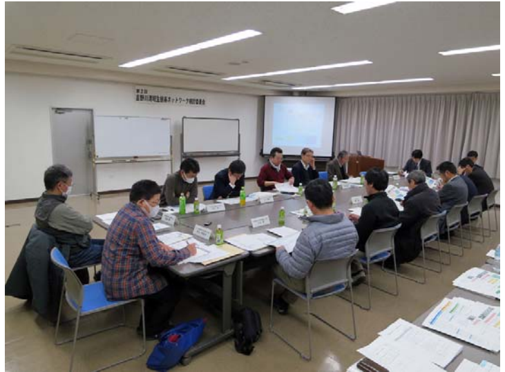
第2回 吉野川流域生態系ネットワーク検討委員会

本委員会は、吉野川流域（徳島県内）において、河川を拠点とした生態系ネットワークの形成を図り、自然からの恵み豊かな地域づくりを進めるために、生態系ネットワーク形成の目標や、多様な主体の協働による具体的な事業展開の方策を検討することを目的としています。