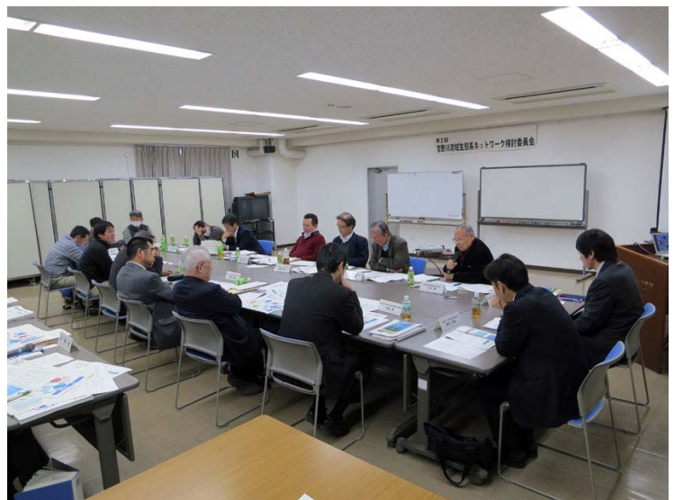
各委員より活発に意見が出されました

今後、プロジェクトの中から3カ年の委員会の中で実現可能なパイロット事業案を事務局側から提示し、来年度から始まる協働参画部会、技術検討部会の中で取り組みメニューや実施方法の検討を行っていくことになりました。