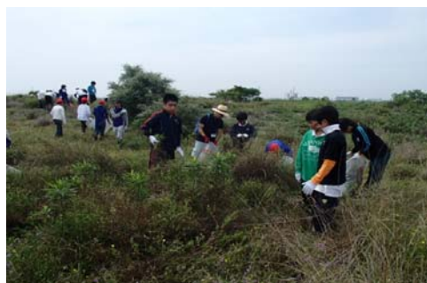
平成26年度の講座の状況②