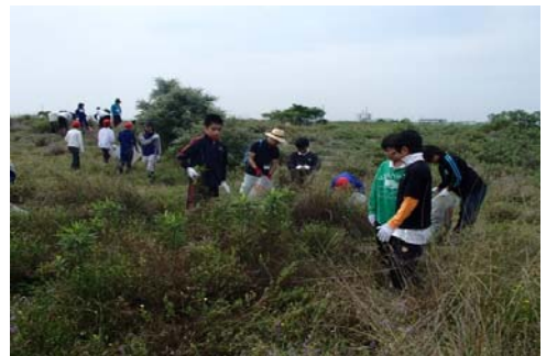
平成26年度の講座の状況②