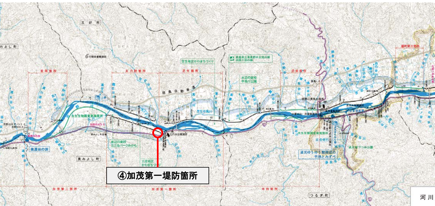
この地図は、測量法第29条に基づく複製承認を得て、国土地理院発行の5万分の1地形図を複製したもの(平23情複、第684号)を一部転載したものである。