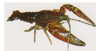
アメリカザリガニ