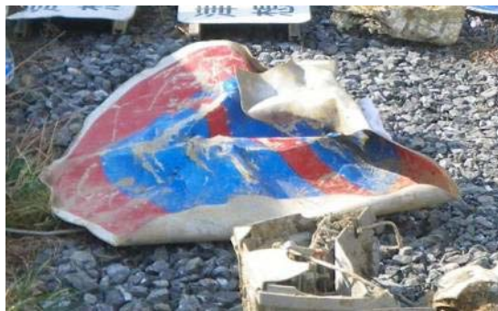
規制標識「駐車禁止」