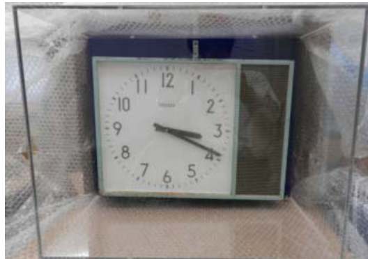
津波の到達時刻付近で止まったままの小学校の時計