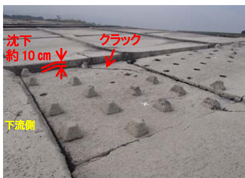
コンクリート版の損傷状況