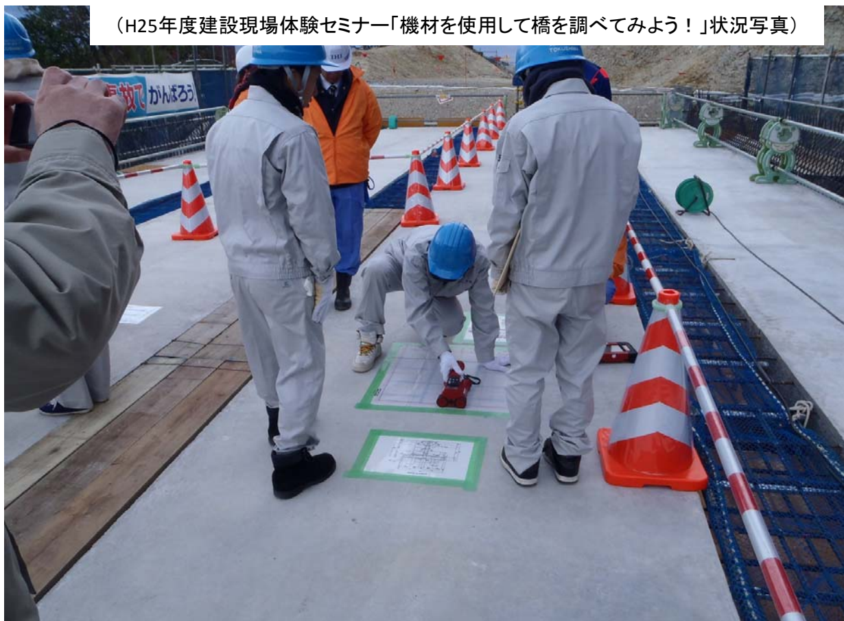
(H25年度建設現場体験セミナー「機材を使用して橋を調べてみよう！」状況写真)