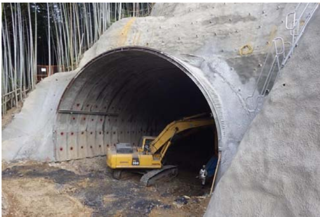
平成24-26年度 田野トンネル工事(平成26年10月現在)