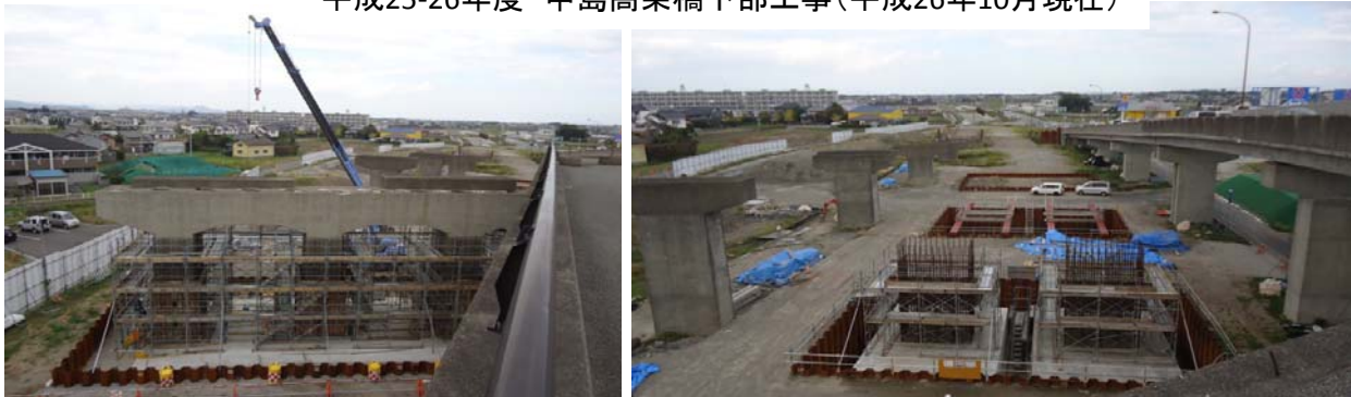
平成25-26年度 中島高架橋下部工事(平成26年10月現在)