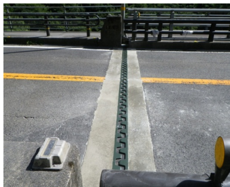
伸縮継ぎ手装置の 取り替え