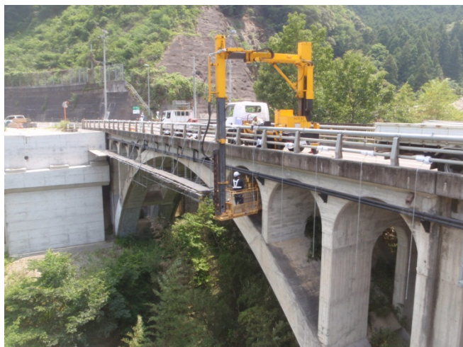
橋梁補修工事の実施状況

今回、補修工事を実施する8橋については、点検時に伸縮継ぎ手装置の異常や漏水、床版や桁のコンクリート部のひび割れや断面損傷が発生しており、対策工として伸縮継ぎ手装置の取り替え、ひび割れ補修工、橋面舗装、鋼橋の現場塗装等を実施する予定です。