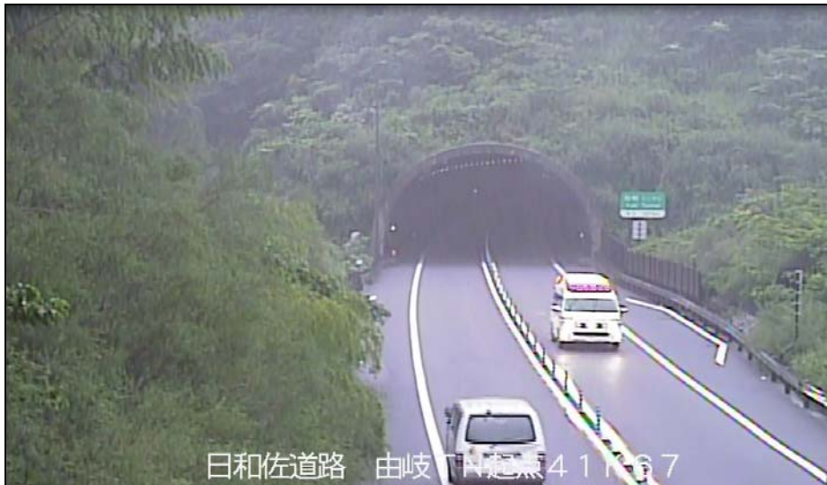
写真. 一般国道55号日和佐道路を走る救急車

平成23年7月16日に全線開通した 一般国道55号日和佐道路 は、平成26年8月の 台風12号や台風11号による大雨においても、常時通行可能 であったことから、 並行する事前通行規制区間 （一般国道55号徳島県阿南市福井町日の地～海部郡美波町北河内（延長10.1km））が 合計83時間05分にわたって全面通行止め であった間の 迂回路として機能し、5回にわたる救急搬送が円滑に進む など、 緊急輸送路としての効果を発揮 したことが分かりました。