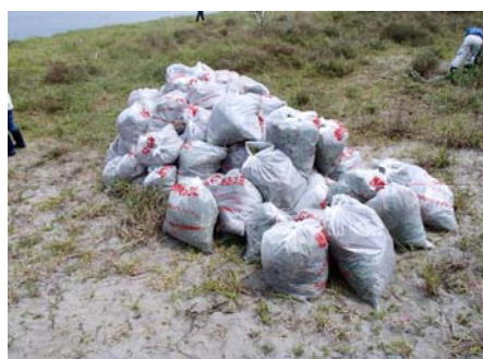
平成26年度 吉野川現地（フィールド）講座結果