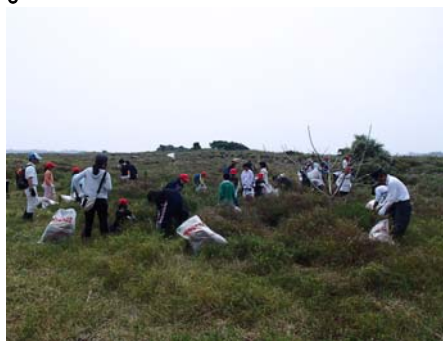
平成26年度の講座の状況