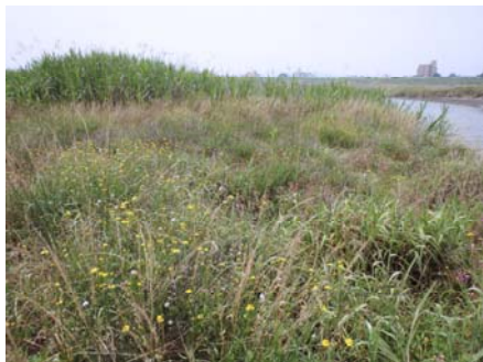
ナルトサワギク繁殖状況

そこで吉野川のかかえる環境の問題点を知っていただくとともに、地域の皆さんの力を借りてナルトサワギクの抜き取りによる駆除作業を行い吉野川河口干潟の海浜植物などを守るため、吉野川現地（フィールド）講座を開催します。