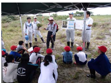
平成26年度の講座の状況