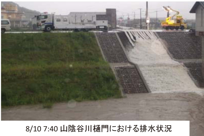
8/10 7:40 山陰谷川樋門における排水状況

この地図は、測量法第29条に基づく複製承認を得て、国土地理院発行の5万分の1地形図を複製したもの(平23情標、第684号)の一部 転載したものである。