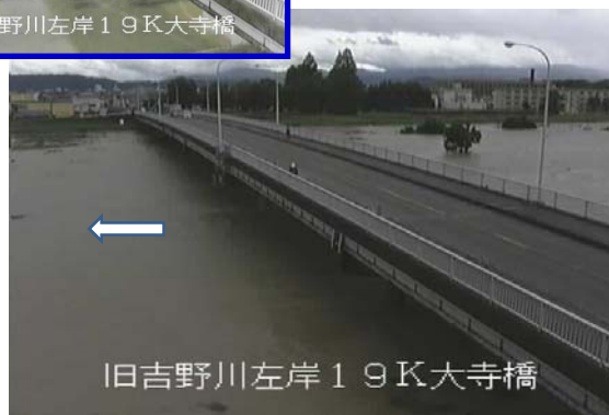
【平成26年 8月10日 9時頃固定カメラ映像】