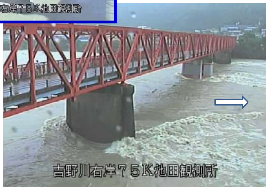
【平成26年 8月 10日 9時頃固定カメラ映像】