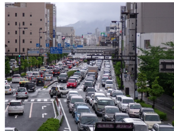
(参考)国道11号の渋滞状況