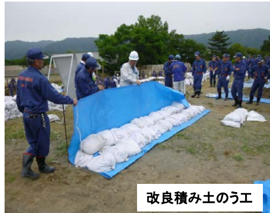
改良積み土のう工