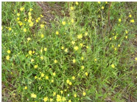
ナルトサワギク繁殖状況

そこで吉野川のかかえる環境の問題点を知っていただくとともに、地域の皆さんの力を借りてナルトサワギクの抜き取りによる駆除作業を行い吉野川河口干潟の海浜植物などを守るため、吉野川現地（フィールド）講座を開催します。