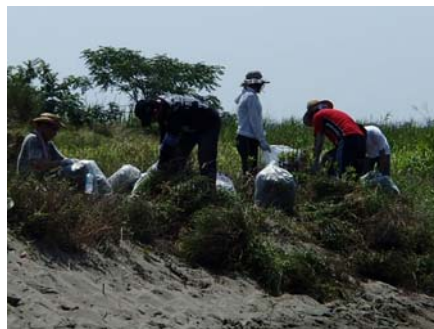
平成25年度の講座の状況