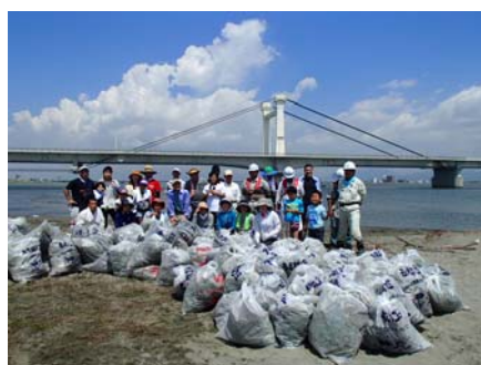
平成25年度 吉野川現地（フィールド）講座結果