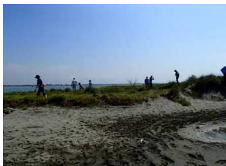
平成25年度の講座の状況