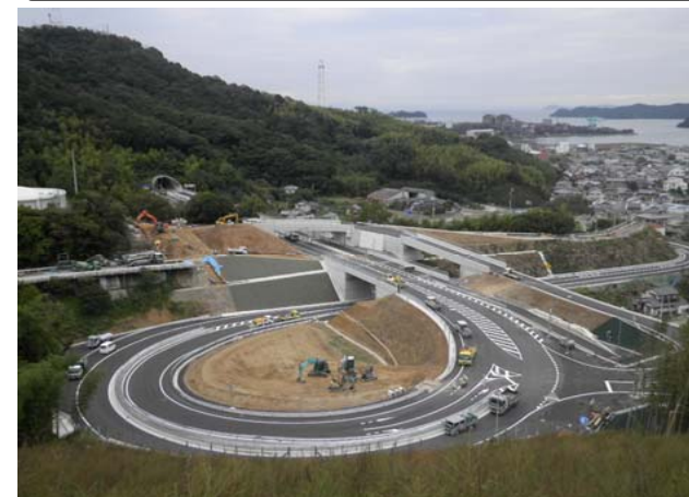
阿南市橋町大浦付近 (撮影日 平成25年10月22日)