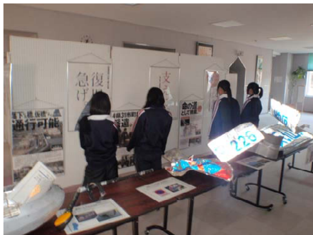
牟岐町海の総合文化センター