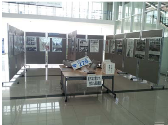
徳島阿波おどり空港