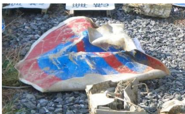
規制標識「駐車禁止」