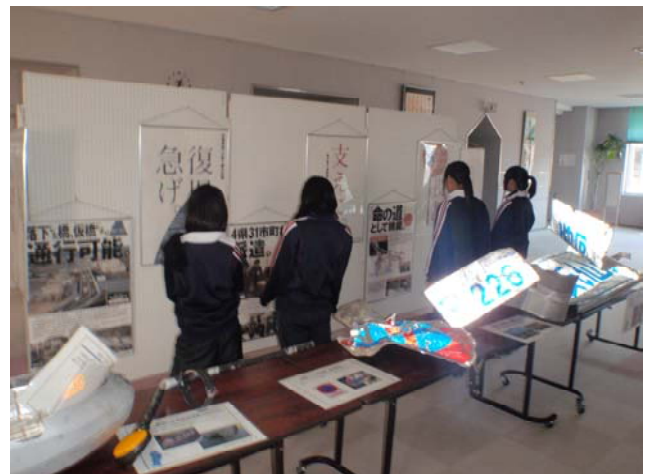
牟岐町海の総合文化センター