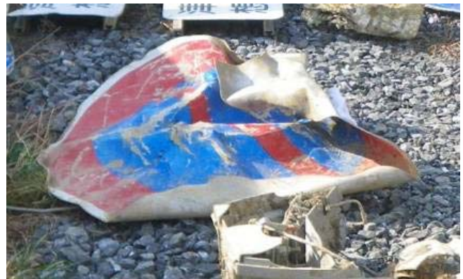
規制標識「駐車禁止」