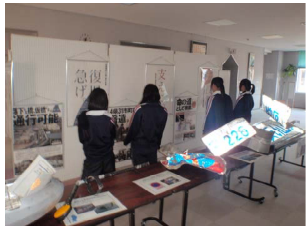
牟岐町海の総合文化センター