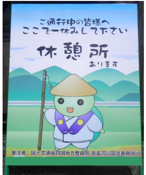
この看板が目印です。