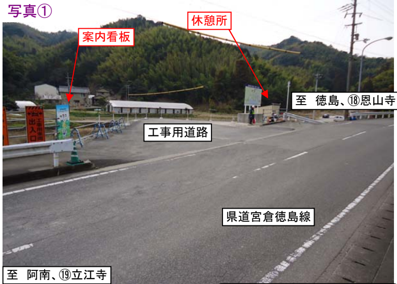
案内看板設置箇所