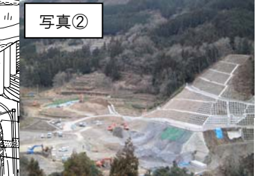
込野地区の工事状況 山切り工事が順調に進んでいます。

◆猪ノ鼻道路事業で発生したクヌギや樫の伐採木を炭に加工して、地域の福祉施設や小学校へ配布。