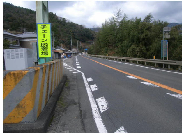
国道32号 三好市池田町白地