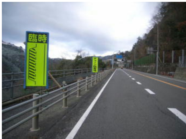
国道32号 三好市池田町西山