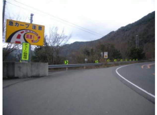
国道32号 三好市池田町西山