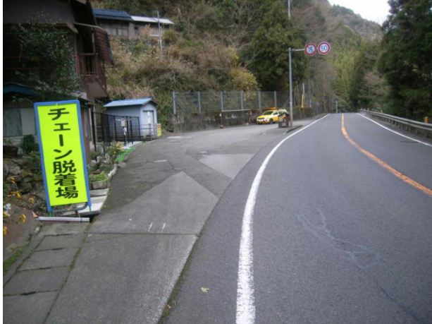
国道32号 三好市山城町下名