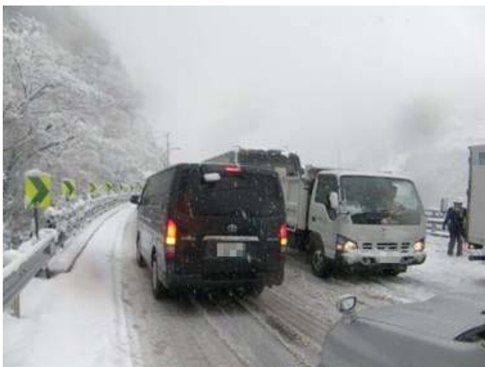
立ち往生状況① (三好市池田町西山)