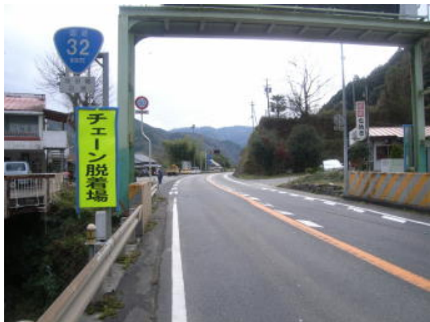
国道32号 三好市池田町白地