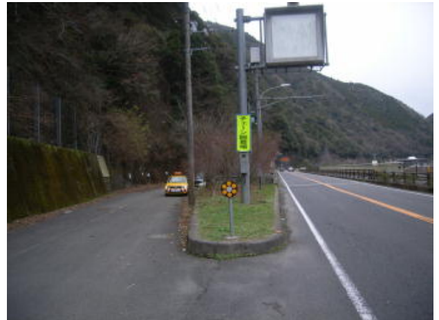
国道32号 三好市山城町下川