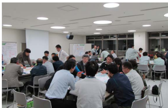
写真1. 危険箇所についての話し合いの様子