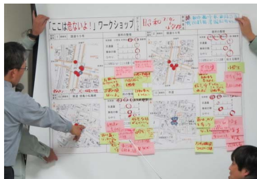
写真2. 各グループ毎の意見発表の様子