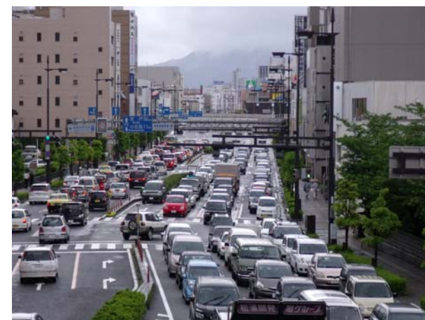
(参考) 国道11号の渋滞状況